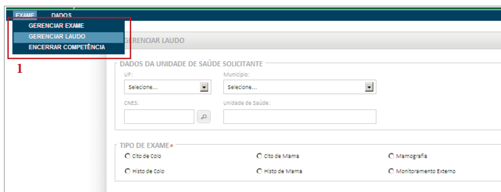
Figura 62 - Gerenciar laudos

Para visualizar laudos o usuário deve acessar o menu “Exame” (1) clicar em “Gerenciar laudo (1)”.